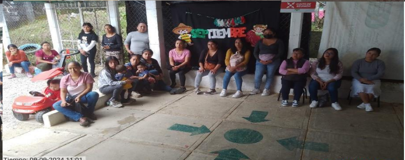
Tiempo: 09-09-2024 11:00 Nota: Plática en Margarita